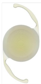
眼内レンズ AcrySof® IQ PanOptix®

多焦点眼内レンズとは、単焦点眼内レンズとは違い遠くか近くの一方にピントが合うのではなく、遠くにも近くにもピントが合うように設計されたレンズのことをいいます。これにより、遠くを見る際も近くを見る際もメガネなしで生活できる可能性が高くなります。